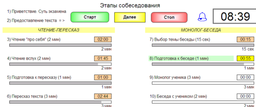
Рис. 1. Интерфейс программы «Собеседник 0.2»

Кнопка «Старт» предназначена для запуска секундомера. По нажатию данной кнопки начинает идти время первого этапа собеседования, требующего слежения за временем. Кнопка «Далее» предназначена для досрочного перехода к следующему этапу собеседования. Кнопка «Стоп» предназначена для остановки секундомера-таймера. Дополнительные комментарии к интерфейсу программы и органам управления приведены на рис. 2.